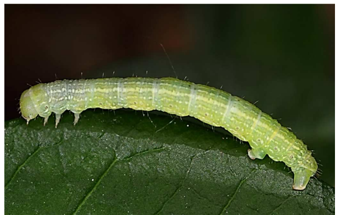
3 par bröstfötter fram (t.h.) och 2 par bukfötter bak.